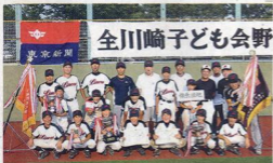
小学生の部で優勝した稗原団地(宮前区)

決勝は、稗原団地がリードすると、みどりが食らい付くように同点に追い付く。好ゲーム。引き分けのまま7回を終え、抽選の結果、稗原団地が優勝を収めた。