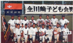
中学生の部で優勝した小倉南(幸区)

で3点を奪い逆転勝ち。第2試合の坂戸第一は、鎌倉(宮前区)と五回時間切れ引き分け。くじで辛くも決勝の1点にとどめた。